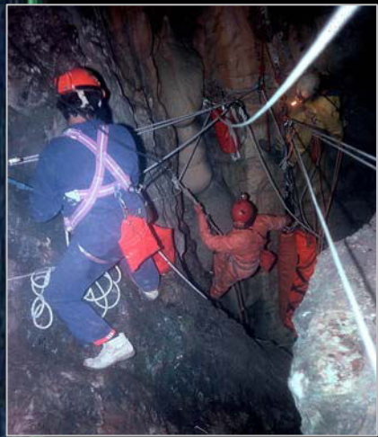
1986. Realizando prácticas de socorro en el pozo de 48 m del sótano de los Lamentos (Cuenca).

Es autor de los libros Trekking y ascensiones por las montañas del mundo (1994, reedición 2006), Los techos de España (1999, reedición 2001), Las 100 cumbres más prominentes de la península Ibérica (2010) y Manual de espeleología , con varias ediciones entre 1997 y 2012, uno de los manuales con mayor difusión en nuestro país.