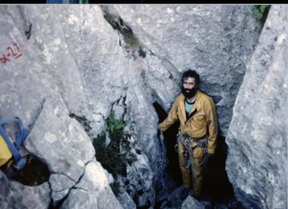
1991. En la entrada del Pozo Luminoso (225 m), en Picos de Europa.