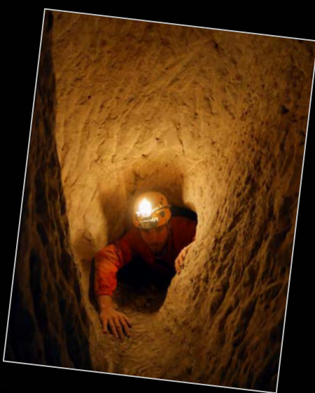
2009. En la mina de lapis specularis de la Mudarra (Cuenca).

Otra de sus pasiones es la fotografía. Tiene unas 45.000 diapositivas y ha conseguido premios en importantes certámenes fotográficos, como los organizados por Fotonatura, Ciudad de Lucena, Ciutat de Sant Feliu, Alto Duero, Colegio de Geólogos, Club Iberia o G.E. Merindades.