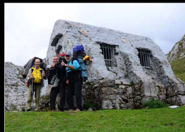
Refugio de Vegarredonda, en Picos de Europa. Dos fotos con 22 años de diferencia.