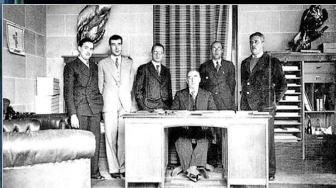
1931. Español (dret amb vestit clar) al Museu de Zoologia.