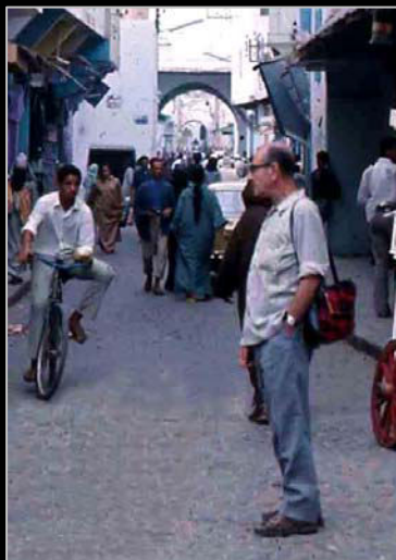
1972. A Casablanca (Marroc).