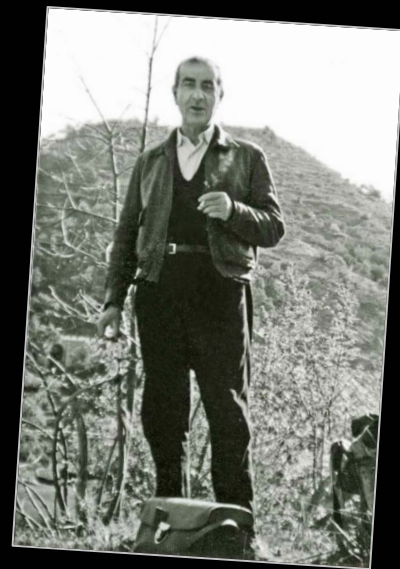
1966. Camí de la cova Cerdanya, (Pina, Castelló).