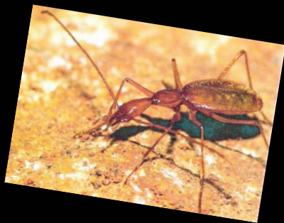
1966. Els més importants coleòpters descrits per Español. Esquerra: Subilsia senenti Esp. 1967, del Marroc. Dreta: Ildobates neboti Esp. 1966, de Castelló.

El 1945 inicia les seves expedicions espeleològiques a la serra d'Aralar (Nafarroa), juntament amb J. M a Thomas, R. Margalef i J. Mateu, tots ells de Barcelona, i amb Laborde, Gómez de Larena, Ruíz de Gaona i els germans Elósegui.