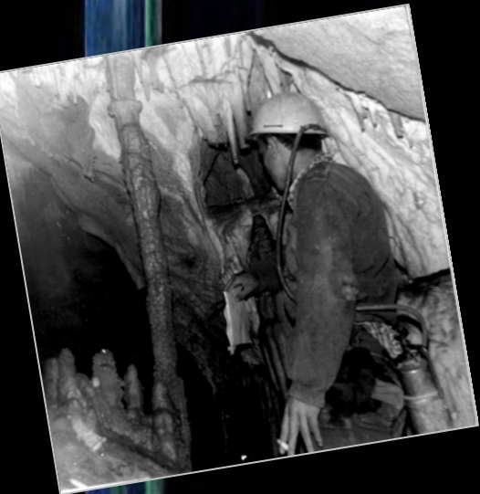
1968. Con la indumentaria de la época, explorando Riocueva (Entrambasaguas).