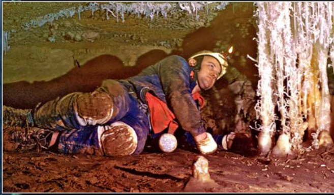
1988. En la cueva del Narizón (Castro Urdiales). Según José León, probablemente "su récord personal de dificultad".