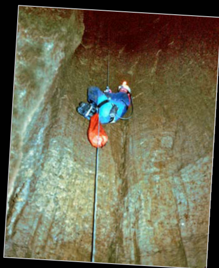
1979. Descendiendo la sima de Los Guías (La Busta, Alfoz de Lloredo)..

Durante su presidencia en la ACDPS se inicia la edición de varias líneas de publicaciones: Memorias ACDPS, Monografías ACDPS y Monografías Arqueológicas, que se siguen editando.