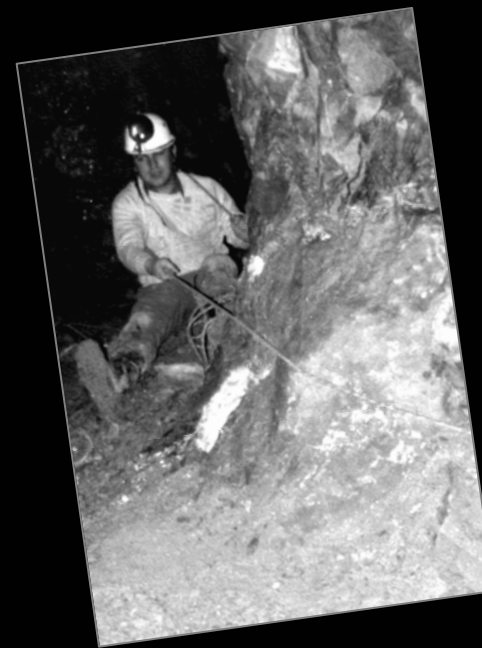
Años 70. Asegurando a un compañero de la SESS en una sima de la zona de Udías.