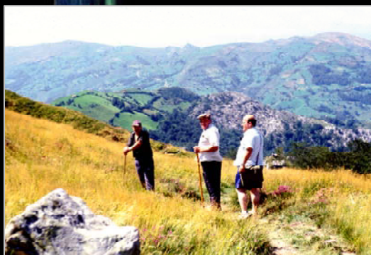
1993. Trabajos de campo para el Catálogo de Grandes Cavidades con el alcalde de Calseca (en el centro).