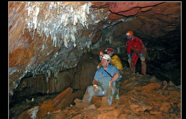
2005. Trabajos de fotografía para el Catálogo de Cavidades de Cantabria, en la cueva de La Buenita, con S. López y F. Fernández Ortega.

Datos proporcionados por: José León García