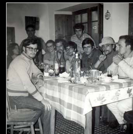
1971. En uno de los frecuentes campamentos de prospección arqueoespeleológica de la SESS, en Cades (Herrerías).