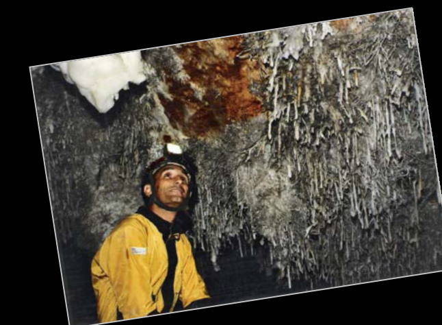
1999. En la cueva del Soplao antes del cierre.