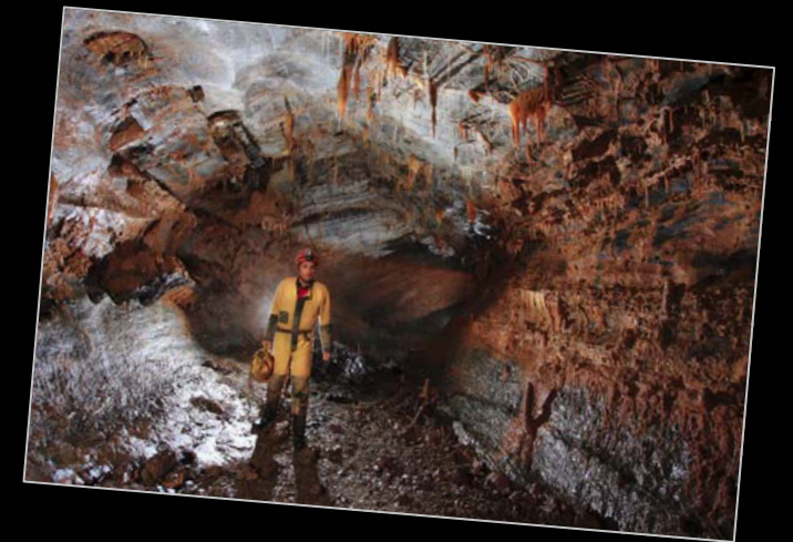
2011. En la Grotte de la Duché (Montagne Noire, Francia).

En el 2008, a raíz de una incursión a la cueva de Fuentemolinos (Burgos) con su compañero Roberto F. García, surge la idea de crear un blog para compartir con todos su obra fotográfica. Posteriormente lo abrirán a los fotógrafos que quieran unirse a la iniciativa.