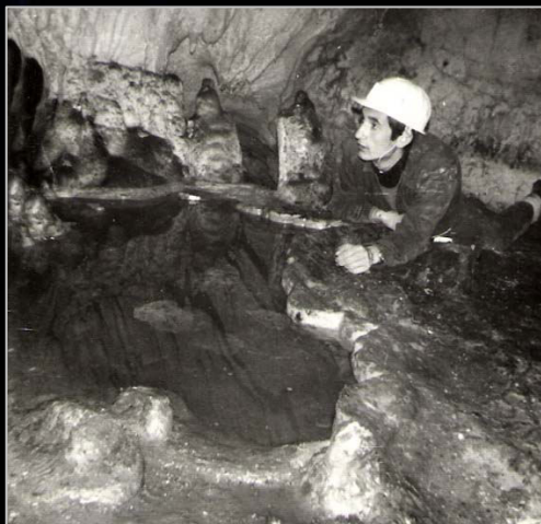
1970. En la cueva Mayor de Atapuerca (Burgos).

nacional de investigaciones científicas por el proyecto "El Altómetro", que proporciona lectura directa y que está basado en el teodolito.