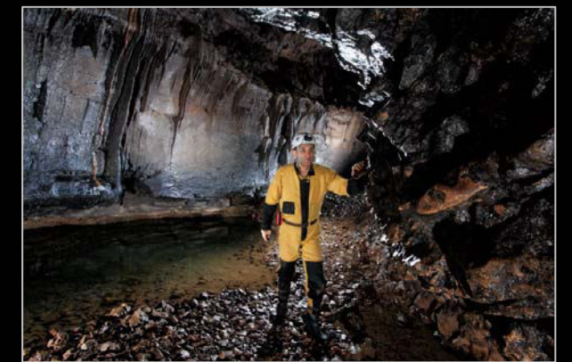
2012. En la cueva del Agua (Soncillo, Burgos).