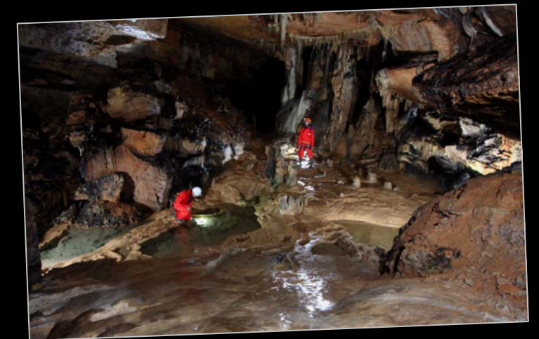
2011. Cueva la Galiana (Soria).