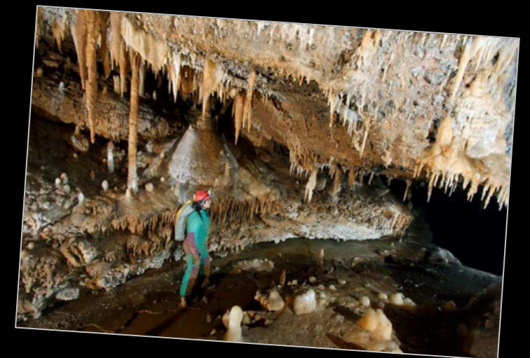
2010. Cueva de Fuentemolinos.

En los últimos años ha realizado trabajos fotográficos en las cuevas de Sorbas (Almería), la Higuera (Murcia), el Murallón (Jaén), Valporquero (León), Los Franceses (Palencia), el Soplao (Cantabria), Galdames (Vizcaya), la Galiana (Soria), Enebralejos (Segovia), Mina de Bustarviejo (Madrid), l'Aguzou, Geant de Cabrespine y Canaletas (Francia) y un largo etc.