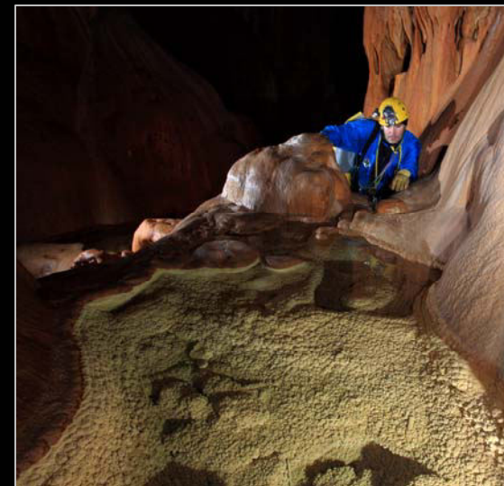
2012. Sima Tximua (Navarra).