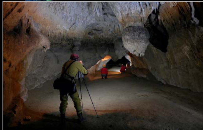
2009. En la cueva de las Vacas de Hoz de Arreba (Burgos), impartiendo un curso de fotografía.

Lorenzo aplica su especialidad profesional como técnico de sonido a diversos proyectos espeleológicos, como el doblaje de vídeos extranjeros, la grabación de un CD de música con las canciones más tradicionales del grupo o la organización de un concierto en la base de la sima Covanegra con el grupo musical Animalversión.