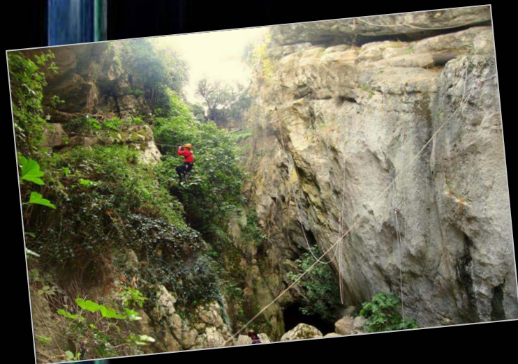
2010. En el cañón del Sistema Altaruta-Villaluenga-La Raja-Maki (Villaluenga del Rosario, Cádiz)