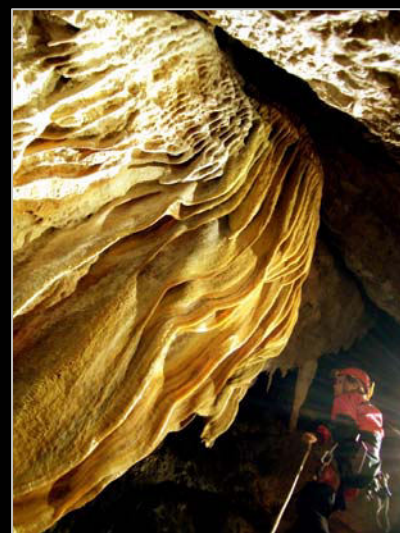
2007. En la sima Del Calamar (Hornos de Segura, Jaén).

Actual Récord-Woman Mundial de la Prueba de Velocidad sobre Sinfín (30 metros). Campeona de España en Categoría Absoluta con Triplete de Oro en los años 2011 y 2012.