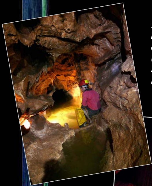
2011. En el interior de la cueva del Farallón (Calar del Mundo, Albacete).