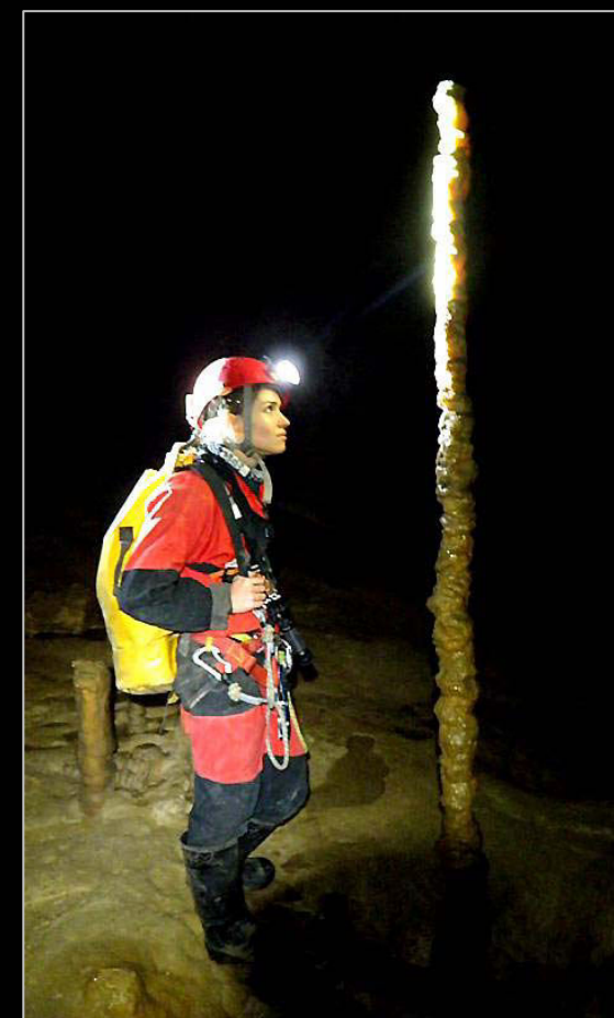
2012. En el Sistema Rayo de Sol – Solviejo (Voto, Cantabria).