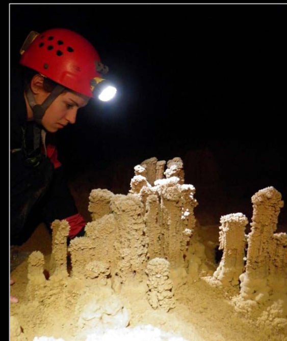
2011. En la sima de Cacao (Villaluenga del Rosario, Cádiz).