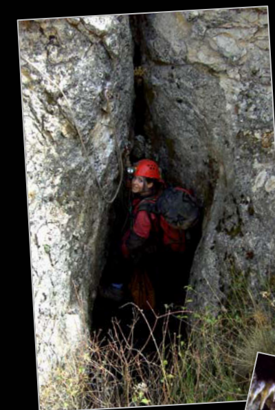
2008. En la sima de las Praelas (Santiago-Pontones, Jaén).