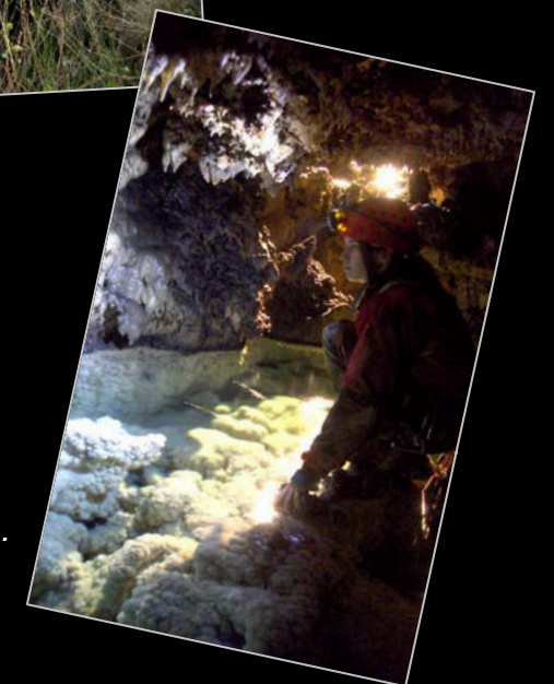
2009. En la sima de Don Fernando (Castril, Granada).