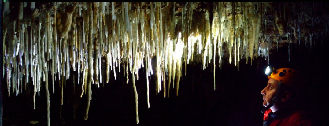
2008. Cova Canaletes (França) en una de les sessions fotogràfiques.

El 1980 va fer un curs d'espeleologia amb pràctiques als avencs Emili Sabaté, el Llamp, l'Esquerrà i el Montserrat Ubach.