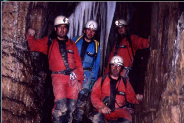
2003. Primera visita a la cova l'Aguzou (França).