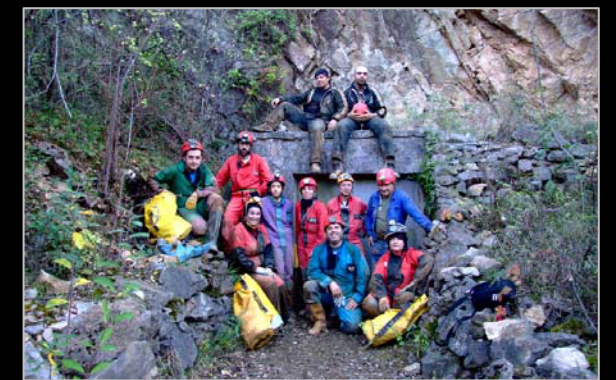
2008. A Lachambre (França), amb companys del Pirenaic, EGAN i SIRE UEC Sants.