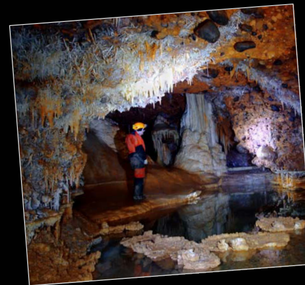
2008. Cueva de Fuente-molinos (Burgos). Visita amb la família Nicolàs.

A més "del seu gran amor" , l'Aguzou, destaquen la TM 71, Cabrespine, Lachambre, Orgnac, Malaval, Pousselières, Crozes, PN 77, Ascensión, Mon Marcou, Vents d'Ange, Grans Canaletes, Gorner, Fontrabieuse, Armand, Demoiselles, Clamouse, Bramabiau, Bosc, Sare, Isturitz, Medous, Esparrós, Dargilán, Thouzon, Bédeilhac, Pêch Merle i algunes de les joies de la Montagne Noir.