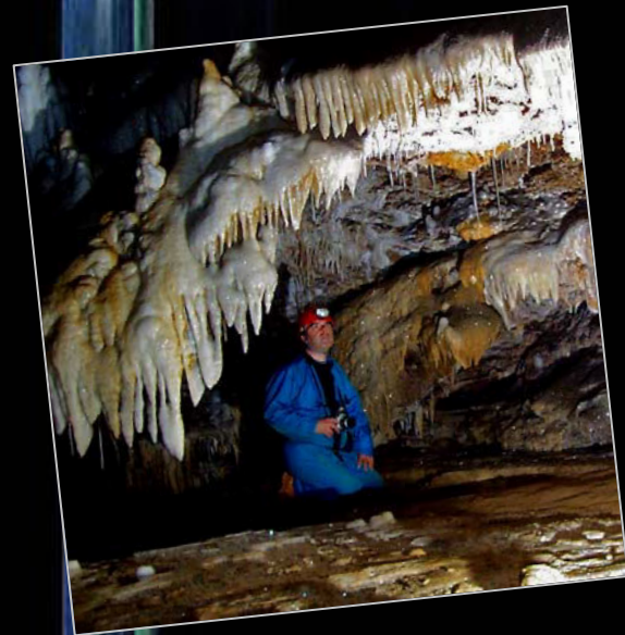
2009. Cova Canaletes (França).