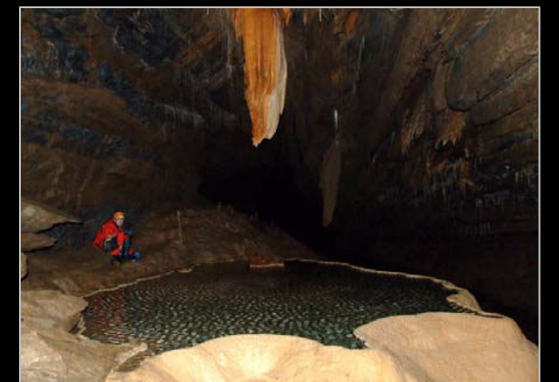
2009. Amb l'Àlex, un col·lega francès, en el Gouffre Geant de Cabrespine (França).