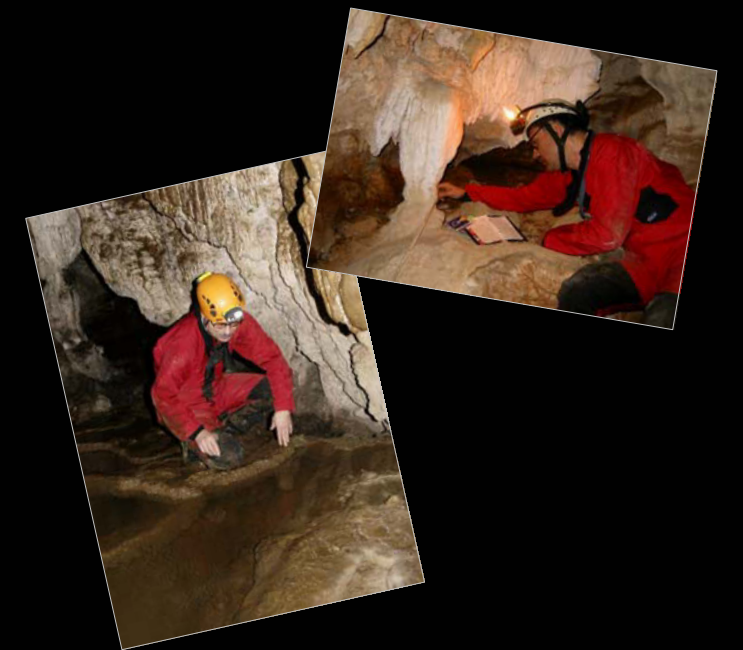
Recopilación de datos: Salvador Vives.