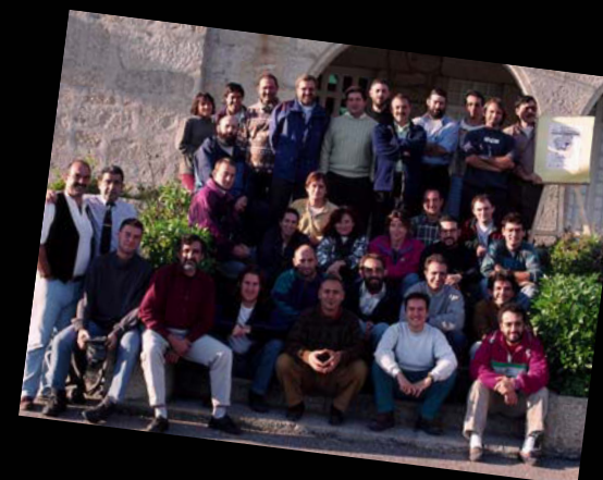
1996. Asistentes al IV Clinic EEE, en A Lanzada (Pontevedra)