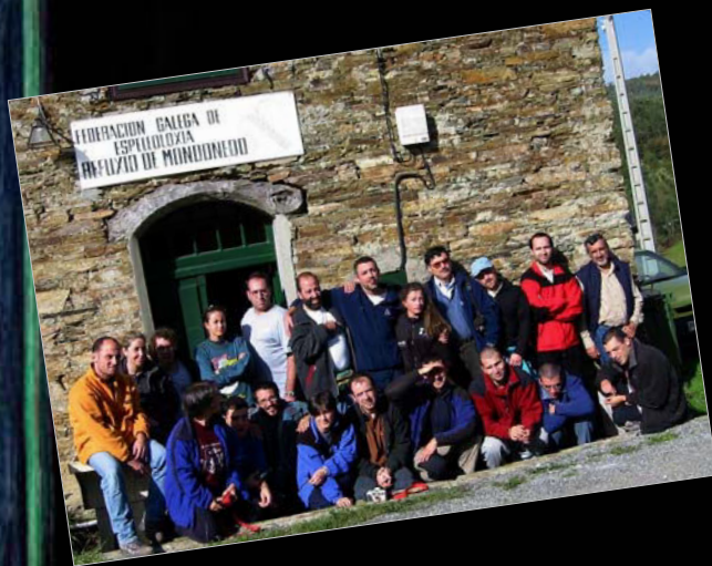
2002. Jornadas de topografía en 3D en el refugio de Mondoñedo.