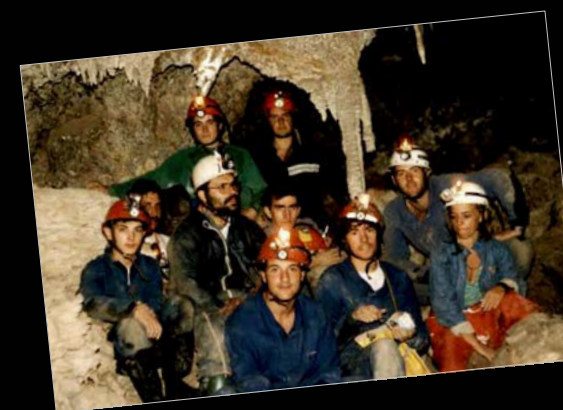
1986. Cueva del Tesoro (Sorbas, Almería). Campamento estatal de la FEE.