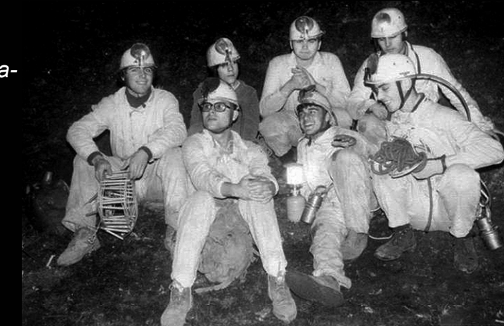
1974. IV Curso de iniciación a la espeleología del GERGO (A Coruña).