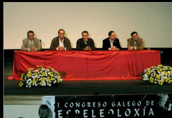
2006. I Congreso Galego de Espeleoloxía, en O Barco de Valdeorras.

La afición por la fotografía subterránea le lleva a plasmar múltiples instantáneas de diversas cavidades. A destacar: Fresnedo, Llonín, Vieya-Los Quesos, Tinganon (Asturias); Coventosa, El Soplao (Cantabria); Piscárciano, Fuentemolinos (Burgos); El Tesoro (Sorbas-Almería), etc. Es galardonado con premios en varios concursos y certámenes fotográficos espeleológicos. También colabora en la filmación de películas espeleológicas, en Super 8, TV y video.