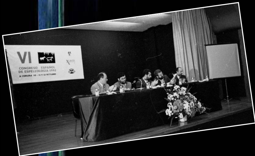
1992. VI Congreso Español de Espeleología en A Coruña.