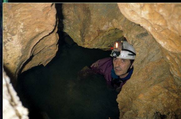
1997. En el pas intermedi del doble sifó de la Cova Urbana de Tarragona.