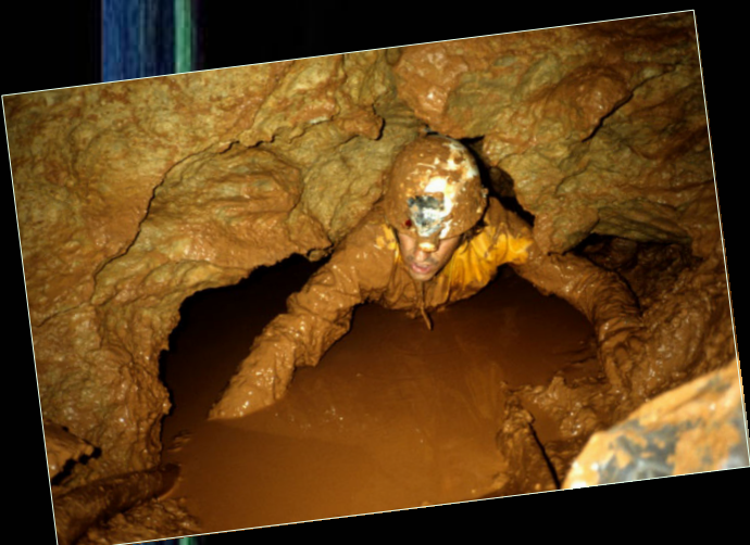
1978. Cova dels sifons (Els Motllats, Baix Camp).

Tanmateix efectua diverses tasques de prospecció a les comarques tarragonines i l'Alt Maestrat. Destaca el treball fet amb companys de l'Espeleoclub de Tortosa a l'avenc dels Mamelons (Mola de Catí - Mont Caro), on aconseguen cotes més profundes i fan noves aportacions a l'estudi de la cavitat.