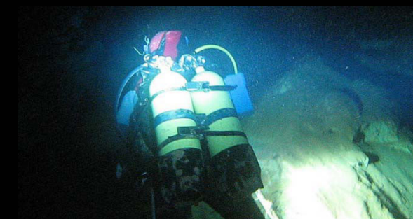
2009. Immersió a la sala Rivemar durant una de les exploracions a la Cova Urbana de Tarragona.

En l'actualitat compagina la seva activitat d'immersió a mar lliure amb l'exploració de la Cova Urbana de Tarragona i altres cavitats amb sifons, com la Font Major de l'Espluga de Francolí.