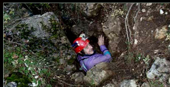
2004. Avenc de la Crisi (Ports de Tortosa)