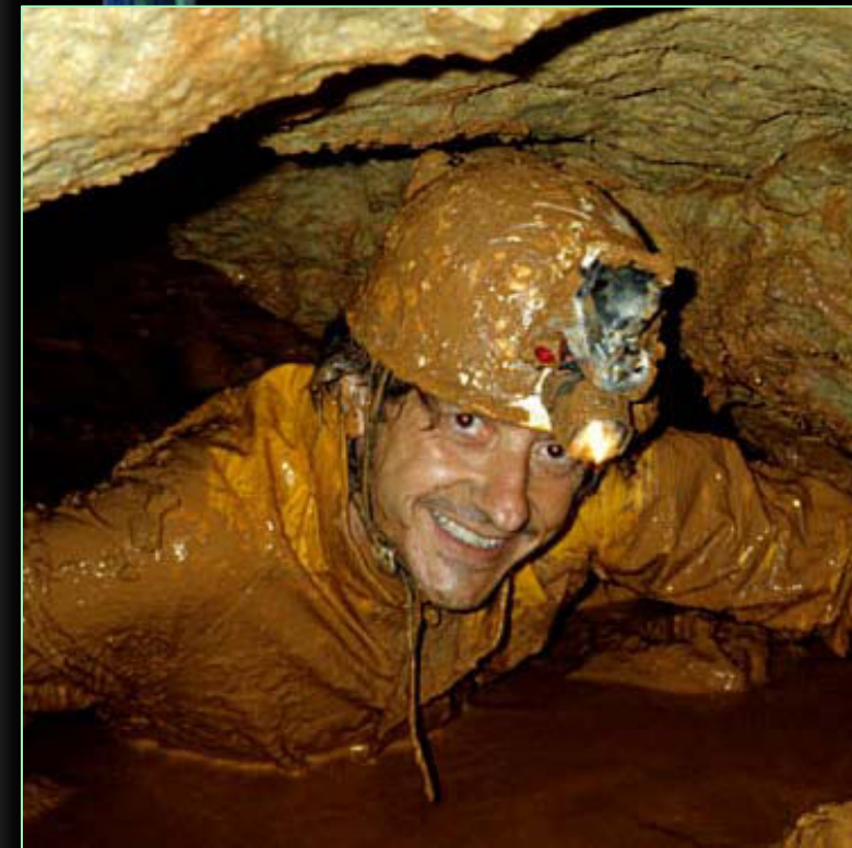
1978. Cova dels sifons (els Motllats, Baix Camp).

Des del principi es va sentir atret per les cavitats verticals, iniciant els entrenaments als avencs de la Torre de Fontaubella, el Pla (Pratdip), la Ferla, la Sibinota, l'Esquerrà, els Esquirols, l'Arcada gran i altres clàssics del Garraf i de l'Ordal.