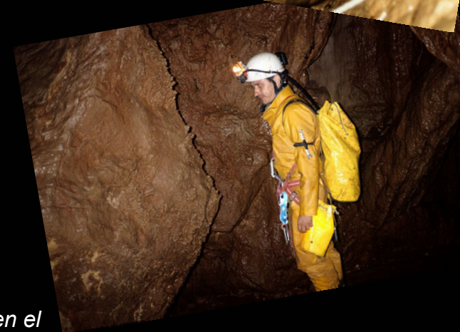
1988. A l'Avenc dels Mamelons (Ports de Tortosa)