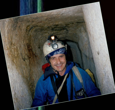
1997. Galeries romanes de La Cova Urbana de Tarragona.

Te el títol de bussejador de tres estrelles i de guia de grup de FEDAS (bussejador monitor de la Generalitat), així con de busseig profund, orientació i navegació, salvament i rescat, busseig en grutes (pas de sifons), suport vital bàsic i administrador d'oxigen. És tècnic d'esport (CIATE) en l'especialitat d'espeleologia i en descens de barrancs.