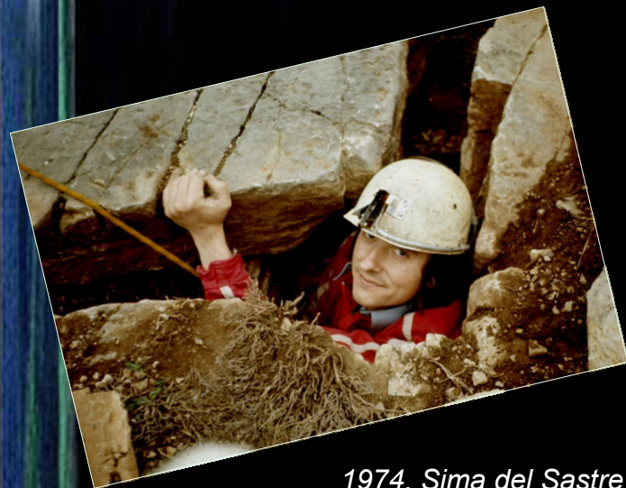
1974. Sima del Sastre (Mosqueruela, Terol).

El 1976 accedeix a l'Escola Catalana d'Espeleologia com a monitor. Dos anys després passa a ser instructor i, finalment, director. És en aquesta època que participa molt activament en la creació de la FCE.