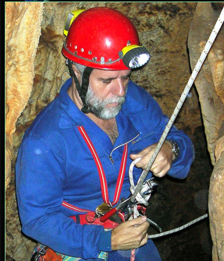
2006. Avenc dels Cans (Selva, Mallorca).

Doctor en geografia, s'ha especialitzat en geomorfologia càrstica i geoespeleologia,