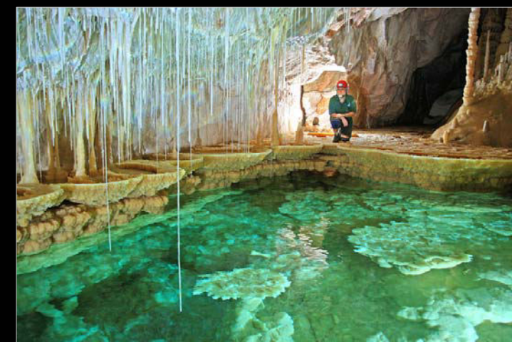
2009. Part final de la Galeria del GELL, a la cova des Pas de Vallgornera (Llucmajor, Mallorca).

Entre 1991 i 2009 ha impartit diversos cursos i activitats dirigits a geògrafs i, sobretot, al professorat d'ensenyament secundari. Tots ells destinats a la divulgació d'aspectes geoespeleològics i de geomorfologia càrstica en general.