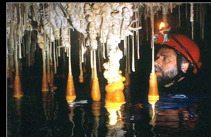
2001. Espeleotemes freàtics d'aragonita a les galeries aquàtiques de la cova des Pas de Vallgornera (Llucmajor, Mallorca).