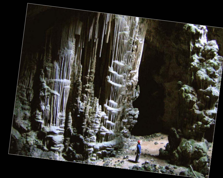
2006. A la gran sala inicial de l'avenc de Sa Moneda (Calvià, Mallorca).