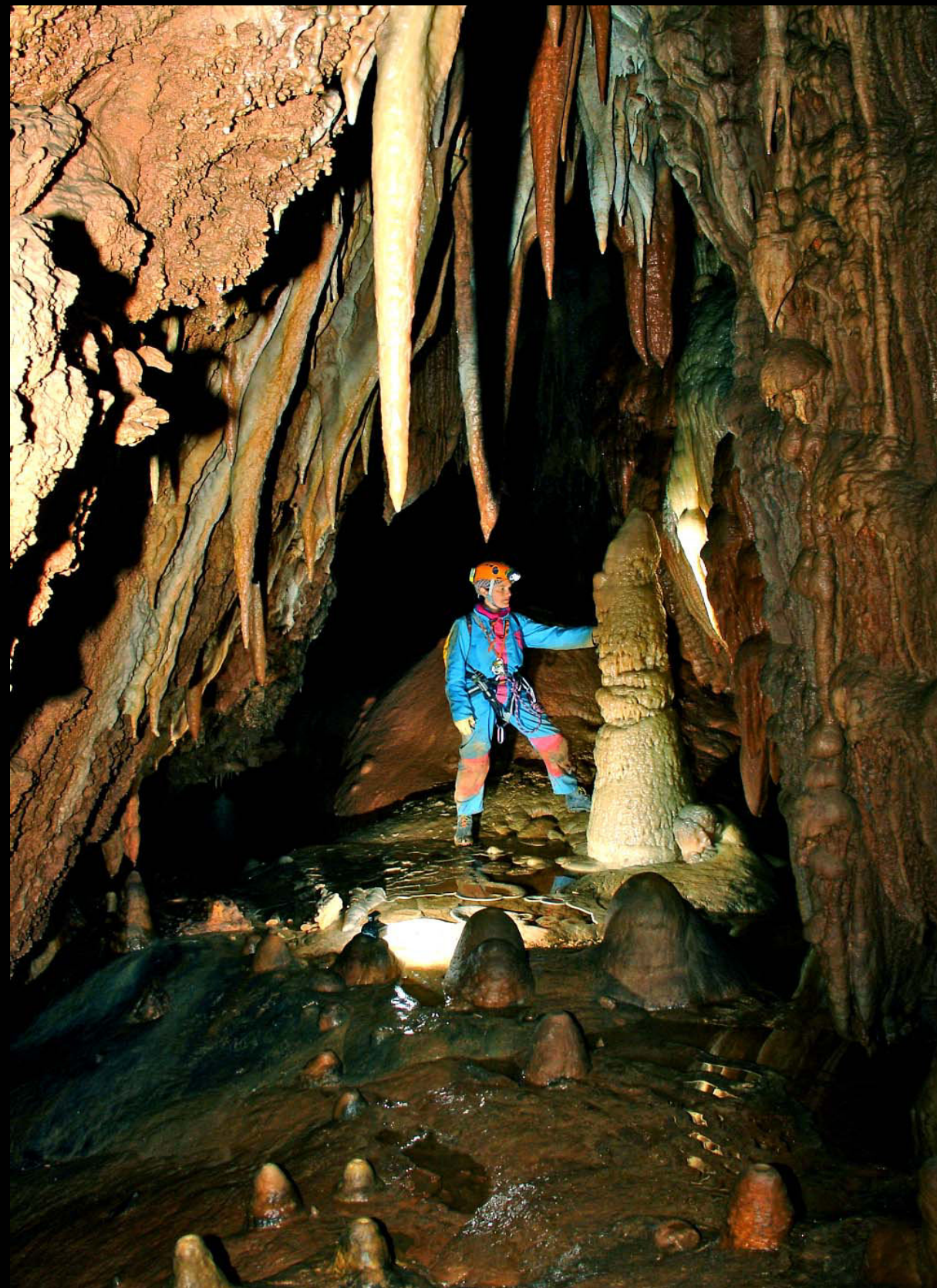
Avenc Sabarín (Tarragona)