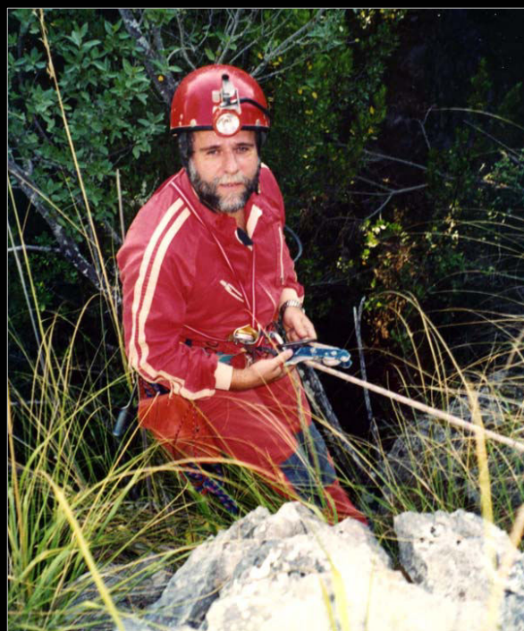
1998. Iniciant el descens a l'avenc de Fra Rafel (Escorca, Mallorca).