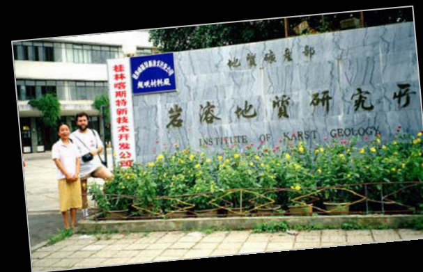
1993. A l'Institut of Karst Geology de Guilin (Xina), durant les activitats del 11è Congrés Internacional d'Espeleologia.