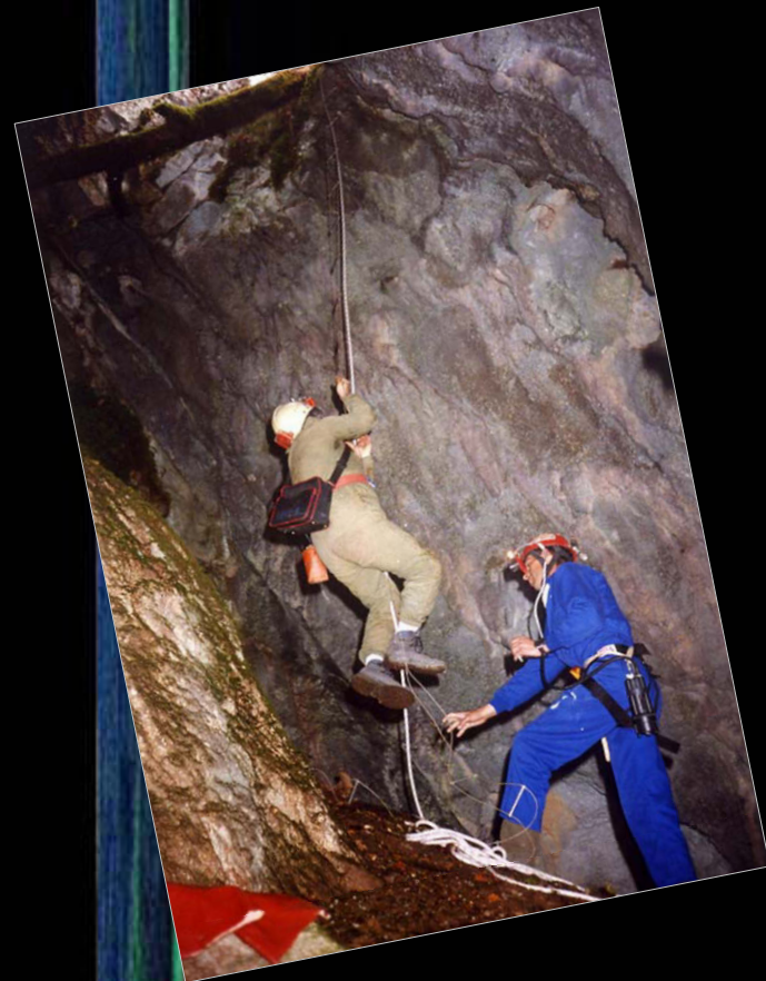
2002. En la primera exploración de la sima de Martín, descubierta por miembros del Grupo Cameros.