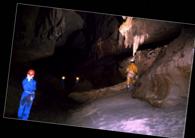
Red del Río Silencio. Galeria Mariló, en una de las exploraciones realizadas entre los años 1988 y 1992.

Forma parte de la organización del IX Congreso Internacional de Espeleología (Barcelona 1986), coordinado los actos que se celebran en Burgos. También de la organización del Seminario de la EEE que se celebra en La Rioja en 1991.