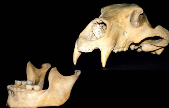
Cráneo de oso y mandíbula humana de la cueva Gonzalo, en el Monte San Cristóbal (La Rioja). La cavidad, situada a 1.750 m de altitud, fué localizada en 1994 por Gonzalo González y Joan Armendáriz.