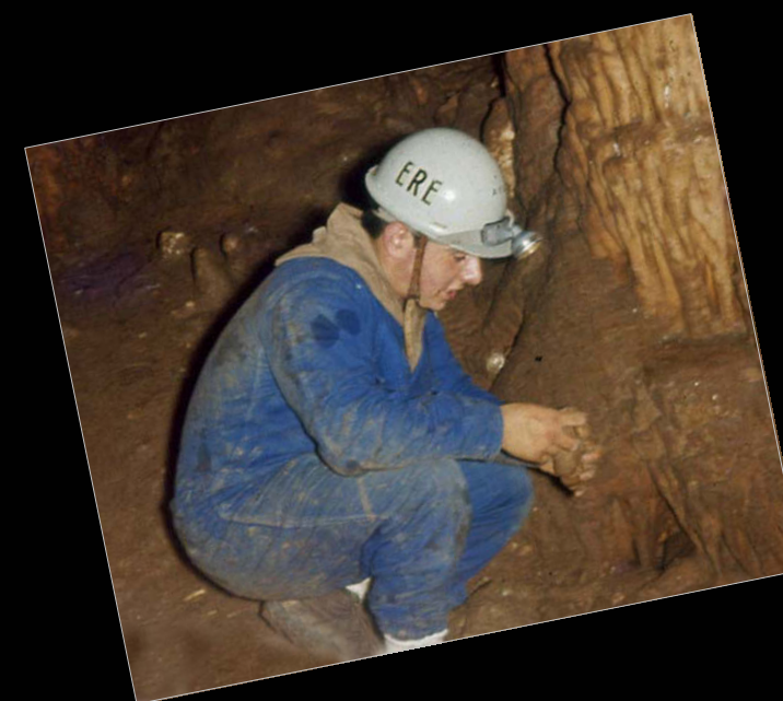
1965/66. En l' avenc Emili Sabaté (Garraf, Barcelona).

A requerimiento de la Dirección General de Deportes de La Comunidad Autónoma, inicia una campaña de divulgación de la espeleología por distintas localidades riojanas. Da conferencias sobre formación de cavidades y ecología subterránea, así como cursillos de iniciación y de perfeccionamiento técnico. Participa en prácticas y simulacros de espeleosocorro.