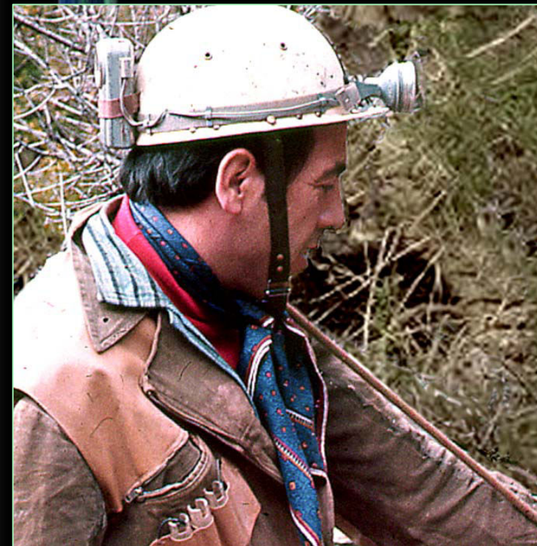
1964. L'Isidre assegurant un company.

Neix el 1926 i s'inicia en l'espeleologia a finals dels anys 50 en el Grup d'Investigacions Espeleològiques del Club Excursionista de Gràcia, del que en va ser president.