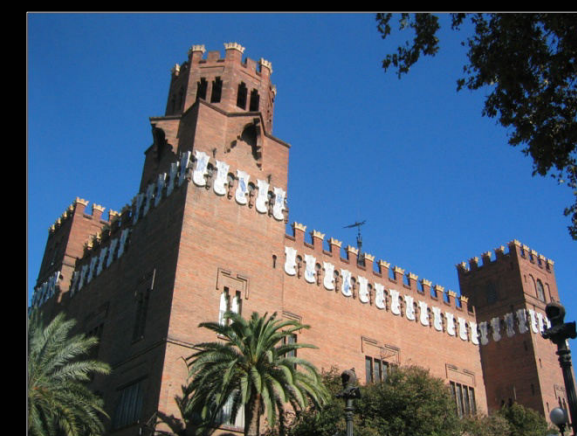
Dades proporcionades per Lluís Auroux i Poblador .

-La Fotomacrografía al servicio de la Biospeleología. Comunicaciones del Primer Congreso Nacional de Espeleología. Barcelona 1970.