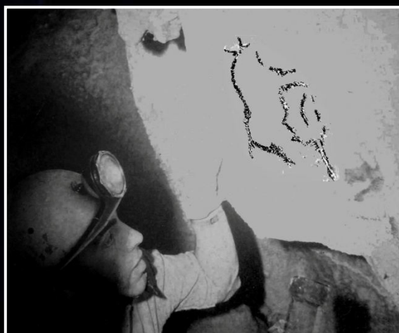
1963. Observant la seva descoberta neolítica a la Cova del Tendo (Montsià).

El 1970 va presidir les sessions de treball de Tècnica i Material del Primer Congrés Nacional d'Espeleologia a Barcelona i del 70 al 76 va ocupar el càrrec de director de la secció de biospeleologia de l'Escola Catalana d'Espeleologia.