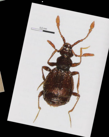
Tychobythinus urgellesi .