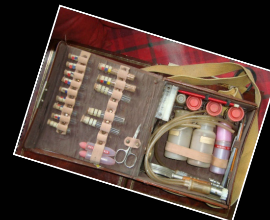
2011. Isidre González Urgellés a casa seva amb els estris de captura de fauna subterrània. La seva vinculació amb el Museu de Ciències Naturals encara segueix.