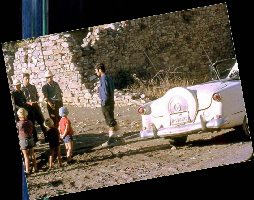
Anys 60. L'Isidre amb el seu descapotable Ford americana, tipus "aiga" que utilitzava amb els companys en les excursions i campanyes.