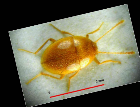
Parvospeonomus urgellesi .

Va descobrir noves espècies de coleòpters cavernícoles que li van ser dedicades: El Paranillochlamys urgellesi Español, 1964 (Cova Bonica, Sant Carles de la Ràpita, Montsià), el Parvospeonomus urgellesi Español, 1965 (Avenc de les Aranyes, Orsavinyà) i el Tychobythinus urgellesi Busuchet, 1974 (Cueva Oscura, Atzeneta, Castelló).