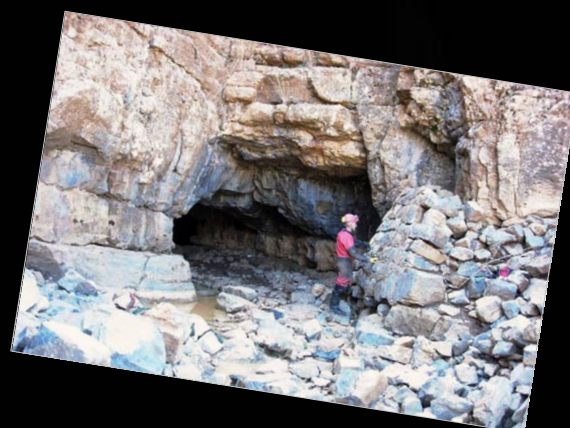
1972. Campanya al Marroc. Entrada de la Ifri N'Touya (Haït M'Hammed (Gran Atlas).

Va fer importants treballs paleontològics i arqueològics, com les restes humanes de la Cova d'Annes (Prullans, la Cerdanya) el 1963, o la pintura neolítica d'un toro a la Cova del Tendo (Sant Carles de la Ràpita, Montsià) el 1964.