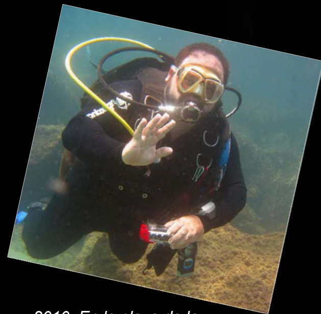
2010. En la playa de la Comandancia (Tarragona), donde los cursillistas suelen realizar las primeras inmersiones.

Autor del Manual d'Espeleologia Subaquàtica Continental editado por la FCE.