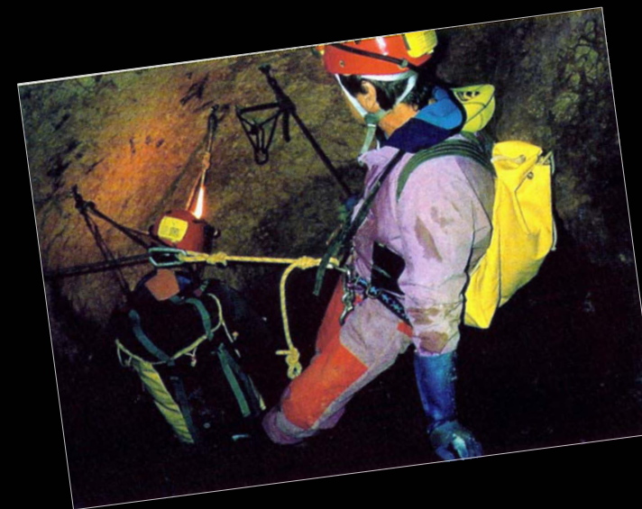
En los primeros pozos de la Cova Urbana de Tarragona.

Datos proporcionados por Antonio Cabezas