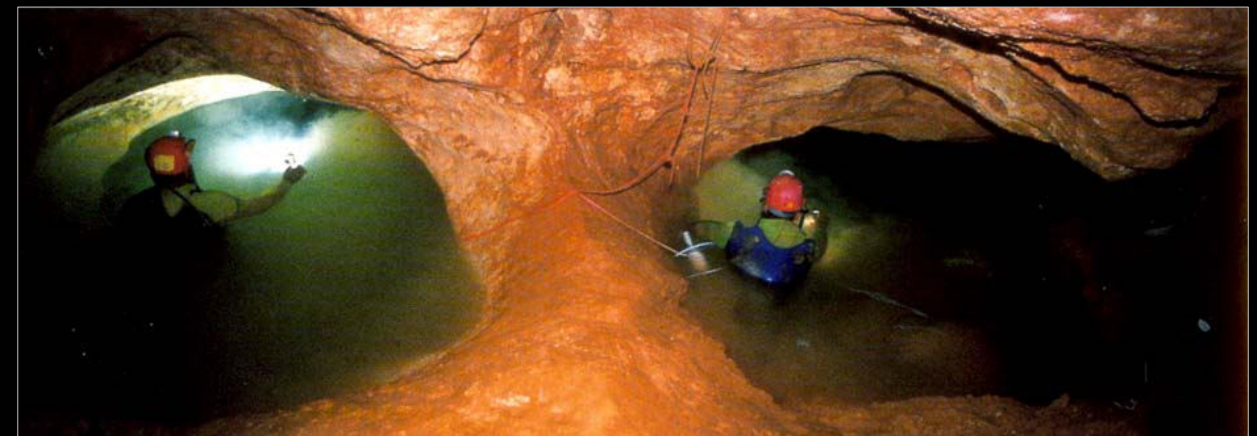
Cova Urbana de Tarragona. Sifones de entrada a la gran sala Rivemar.