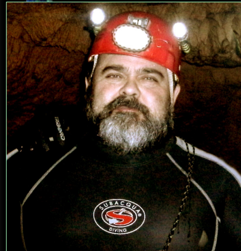
2010. En la Cova de la Font Major. L'Espluga de Francolí (Tarragona).

Ha sido el vicepresidente de la Federació Catalana d'Espeleologia (2000-2004), responsable de su Departament d'Espeleologia Subaquàtica Continental (2002-2010) y del Comité de Jutges (2009-2010).