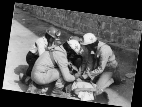
1978. Diversas imágenes de prácticas de espeleosocorro en el castillo de Montjuïc con la Compañía Alpina de la Cruz Roja.