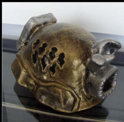
2009. Trofeo de los Premios Espeleo.

Es el fundador de los Premios Espeleo , que reconocen a personas, clubs e instituciones su labor desarrollada en pro de la espeleología andaluza