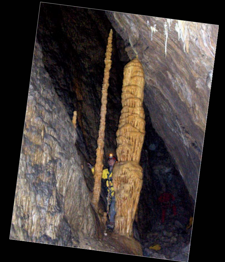
2005. Exploraciones en el Sistema de la Murcielaguina

Ha participado en varias campañas espeleológicas en la provincia de Jaén, en especial las desarrolladas en los términos municipales de Siles, Hornos de Segura, Santiago de la Espada-Pontones y Villacarrillo. Fuera de la provincia destacan las exploraciones llevadas a cabo en la Cueva de los Chorros (Riópar, Albacete).