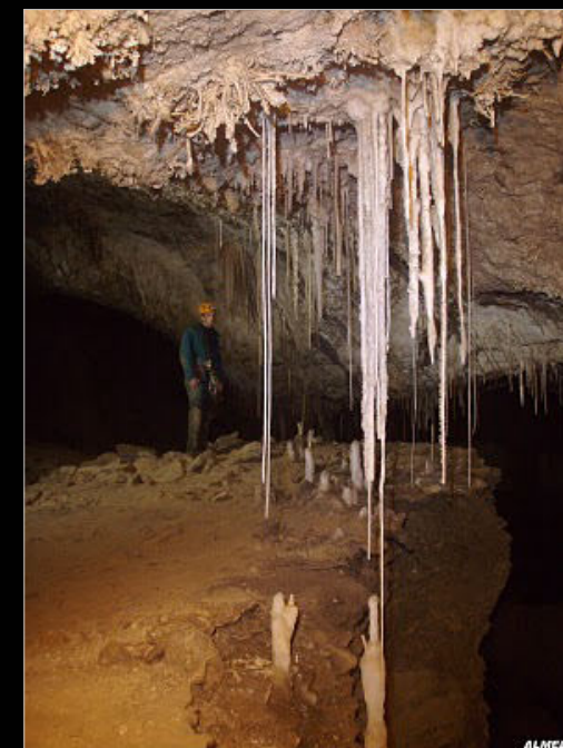
Sima de la Piedra de San Martín

Actualment participa en el projecte "Interclub Castelló" que pretén relacionar els grups d'espeleologia de la província i potenciar la capacitat d'exploració.