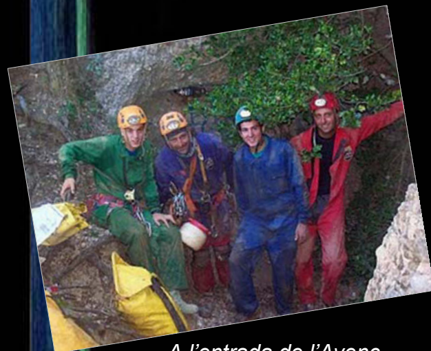
A l'entrada de l'Avenc Montserrat Ubach