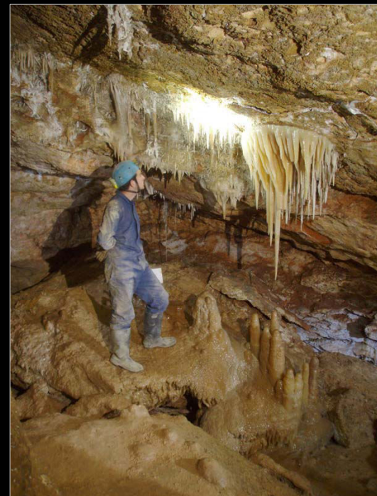
2010. A la Cova de l'Autopista (Gandia, València)

És autor de nombroses topografies i un expert en desobstruccions de cavitats.