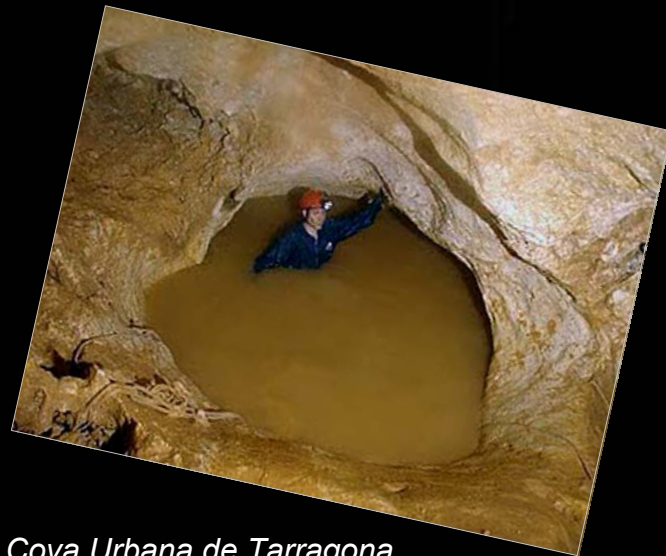
Cova Urbana de Tarragona