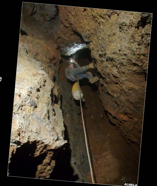
Baixant l'avenc de l'Indi (Oropesa del Mar, Castelló)

Actualment participa en el projecte "Interclub Castelló" que pretén relacionar els grups d'espeleologia de la província i potenciar la capacitat d'exploració.