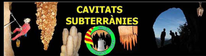
Algunes de les activitats de l'autor publicades al blog de l'ECC:

Ha realitzat diverses visites a cavitats de fora de la província, com ara València, Teruel, Pirineus, Cuenca i Cantabria, algunes d'elles publicades al blog de l' 'Espeleo Club Castelló "cavitats subterrànies" que edita junt el seu germà Lluís.