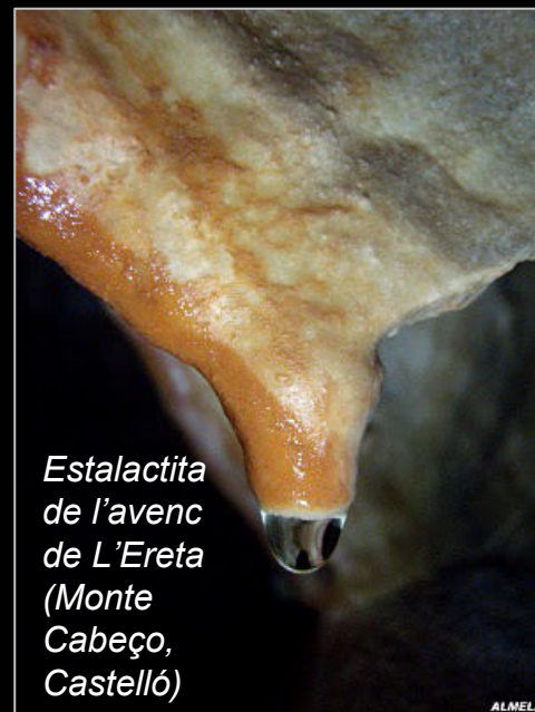
Estalactita de l'avenc de L'Ereta (Monte Cabeço, Castelló)