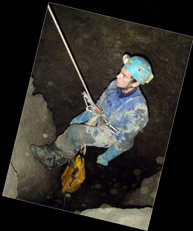
2010. Jesús al sistema Río Munio (Cantabria)